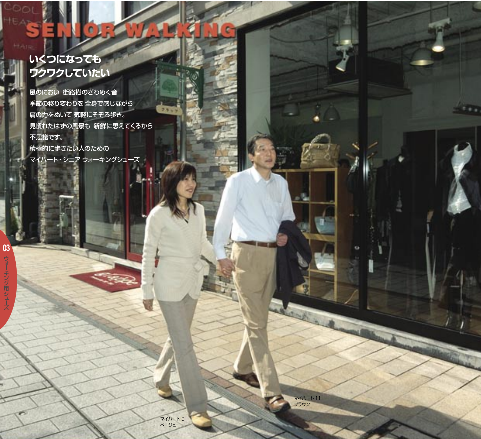
マイハート11 ブラウン