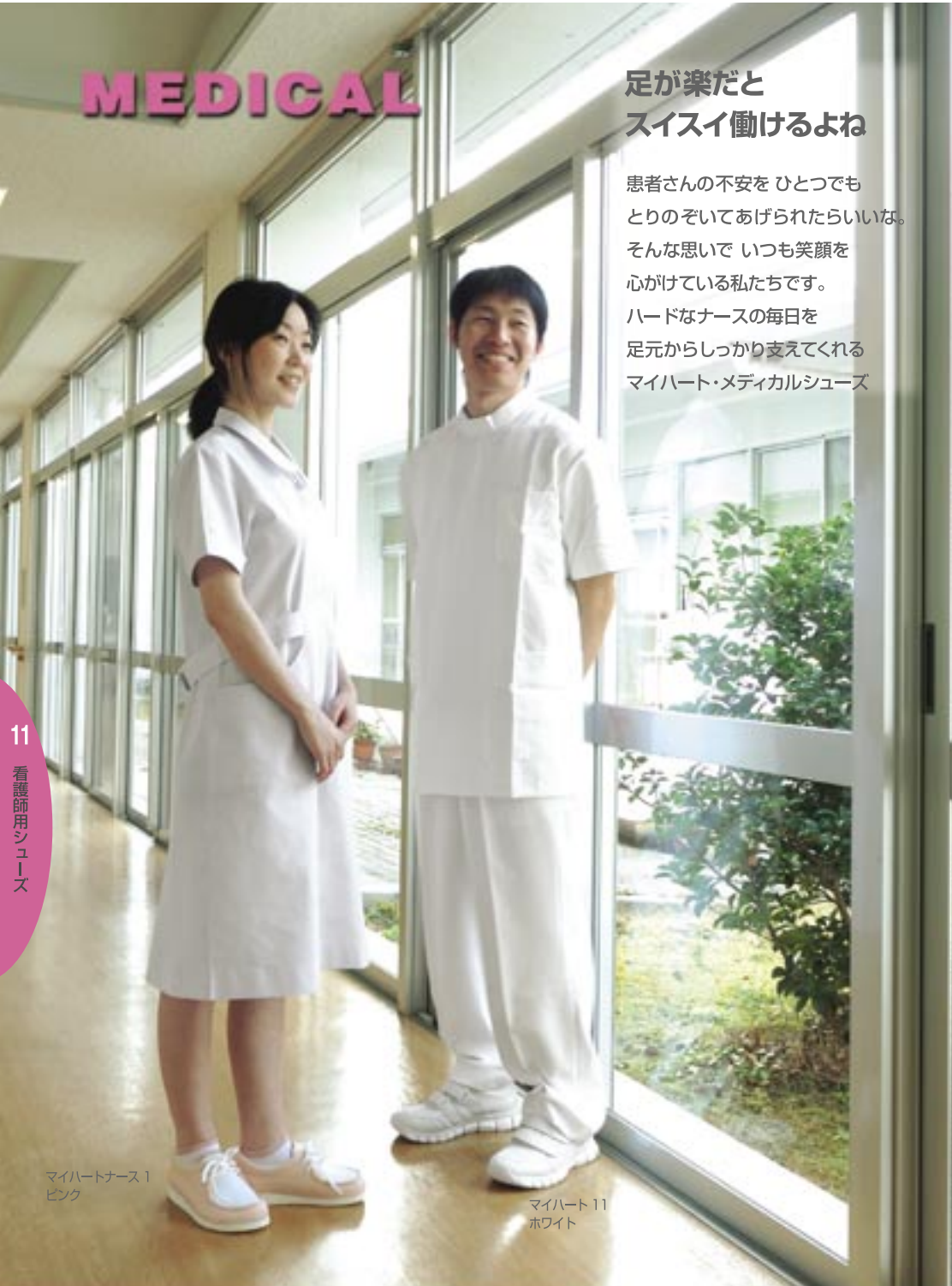
マイハートナース1 ピンク